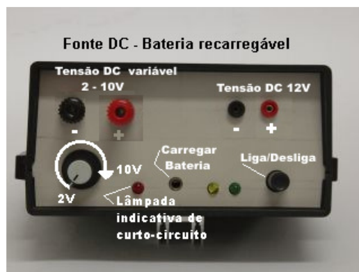
Figura 3 - Painel da fonte de corrente contínua

Sempre verifique se as fontes estão desligadas (todos os LEDs apagados) antes de guardá-las.