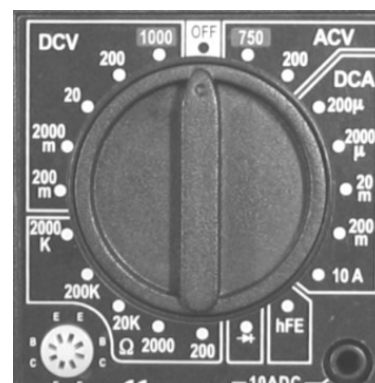
Figura 2 - Detalhe da chave seletora do multímetro

A seleção de função e escala é feita pela chave seletora (figura 2). É importante que não haja aplicação de tensão nos terminais do multímetro enquanto a chave seletora não estiver na posição correta. A utilização de uma escala errada pode danificar o multímetro irremediavelmente. Por isso, é sempre importante desligar a fonte de tensão enquanto se faz uso da chave seletora. Em nenhuma circunstância deve-se ligar o multímetro ao circuito ou mudar a chave seletora com a fonte ligada!